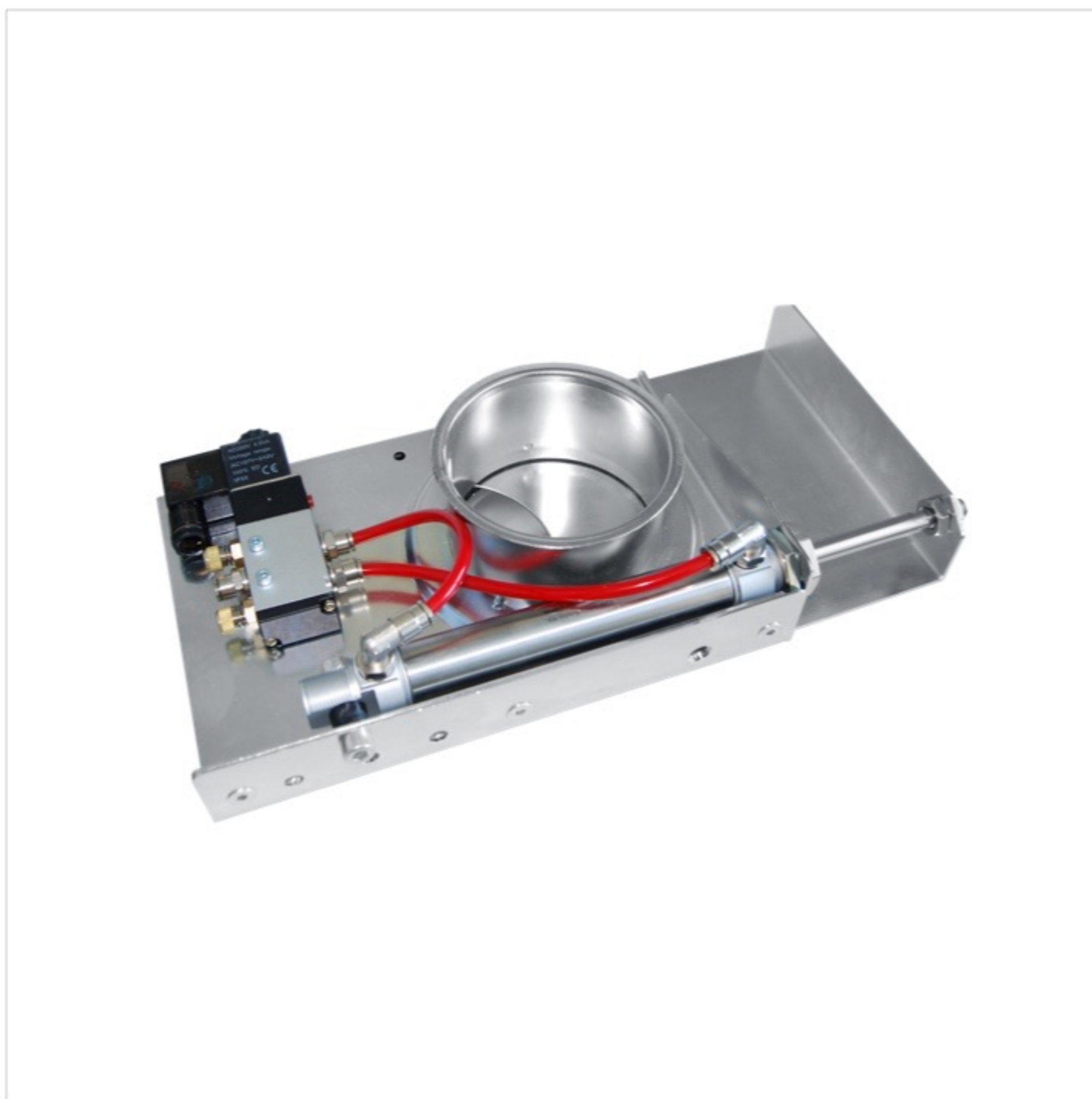
AUDA - Skjutspjäll tryckluftsdrevet

Försäkran om överensstämmelse enligt EU-direktiv 2006/42/EG. Var medveten om att enheten inte kan tas i bruk förrän maskinen eller systemet där spjället skall ingå, uppfyller kraven i EU:s maskindirektiv.